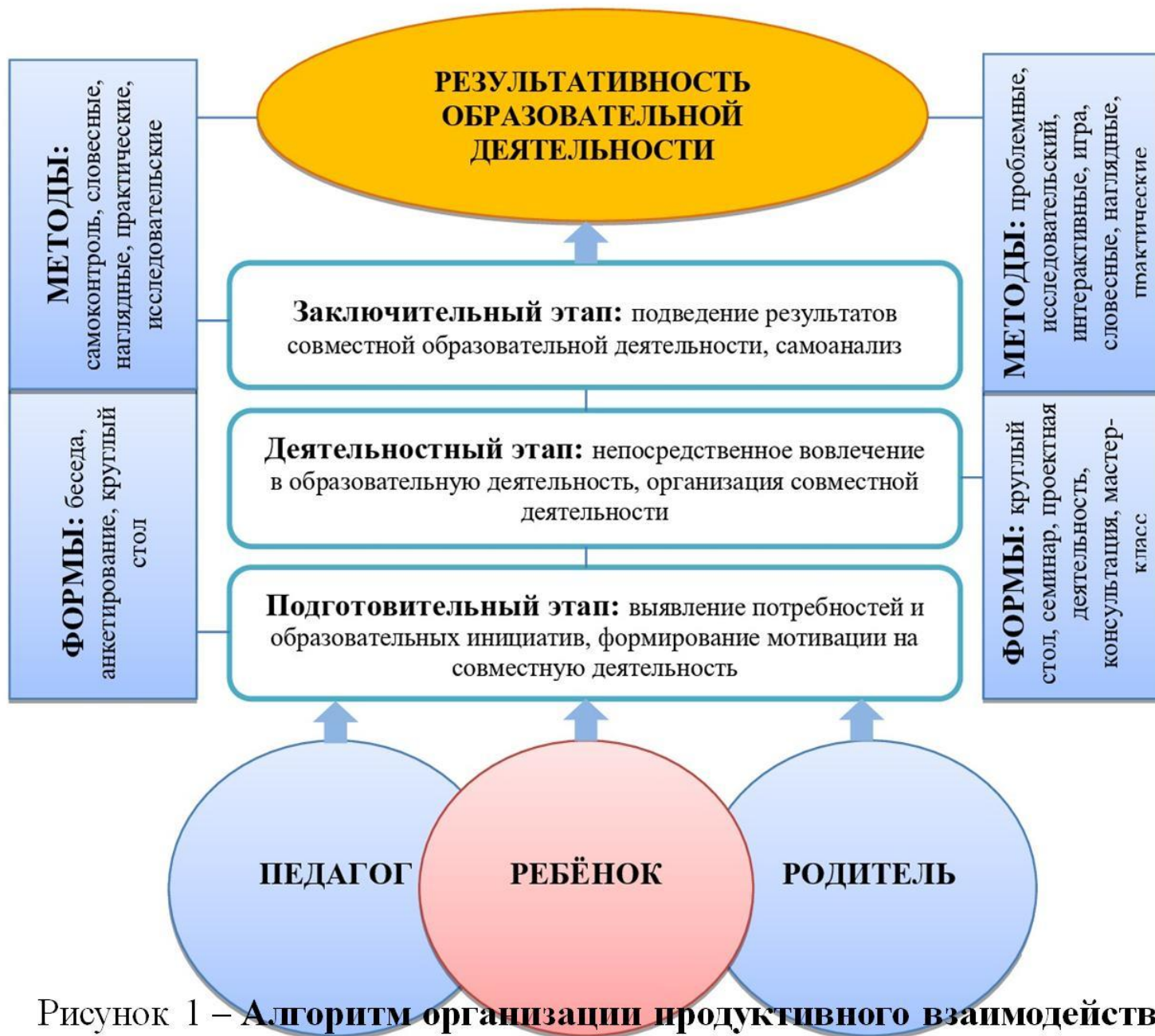
Рисунок 1 – Алгоритм организации продуктивного взаимодействия ДОО с семьями воспитанников